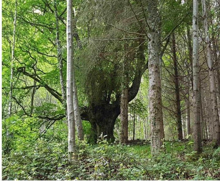
Babestu nahi diren pago mugarratuen adibide bat.