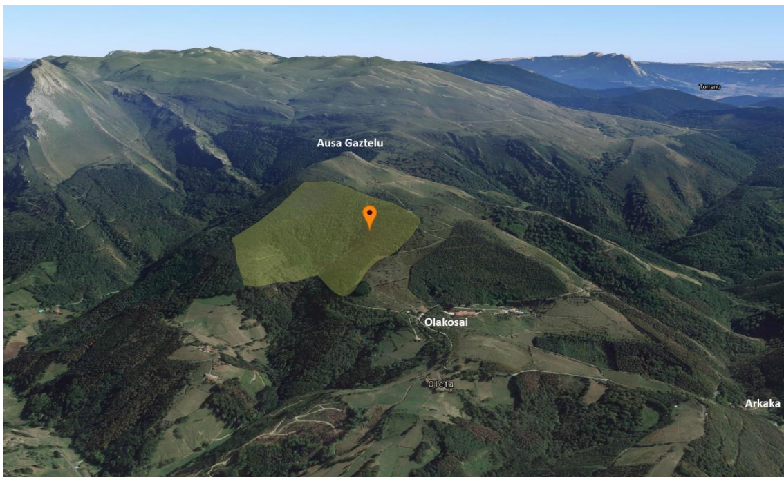
Pago mugarratuak mantentzeko lanak egingo diren gunea.

Ausa Gaztelu mendiaren magalean, zuhaitz exotikoak landaturiko zenbait eremutan neurri handiko hainbat pago mugarratu mantentzen dira, baina inguruko zuhaitzen kompetentziak hauen bizirautea zailtzen du. Horrelako zuhaitzak oso baliotsuak dira bioaniztasunarentzako eta horregatik, hauen egoera hobetzeko inguruko zuhaitz exotikoak botako dira, zuhaitz handi hauen adaburuak libre uzteko adina.