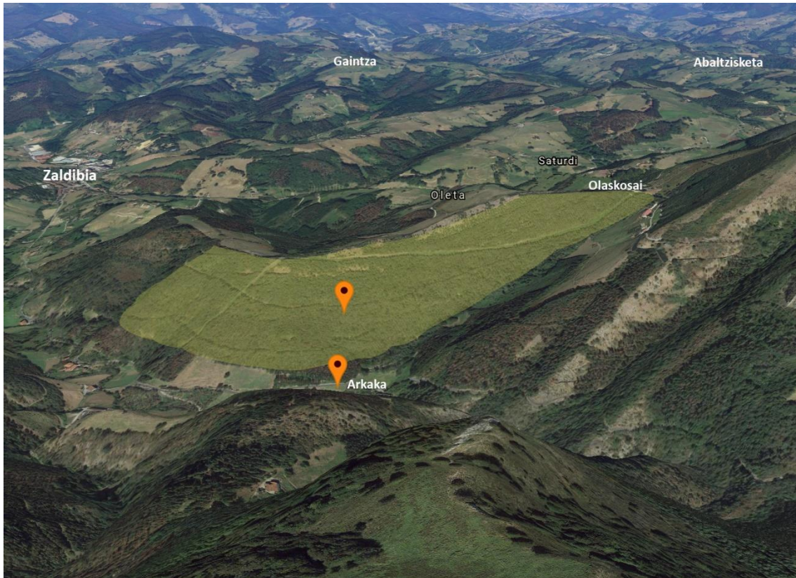
Bertako basoa berreskuratzeko tratatuko den eremua eta Arkakako putzua.