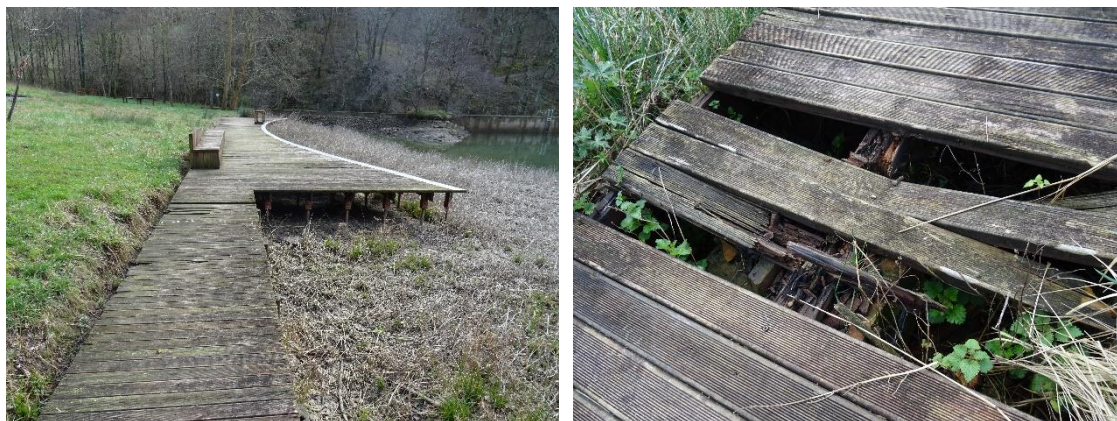
Arkakako putzuan kenduko diren egurrezko egiturak.

lurra berdindu eta bertako espezieen landaketak egingo dira gaur egun eraldatuta dauden bi ertzetan.