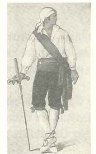
ZALDIBIAKO dantzarria (XVIIIgarren mendea)