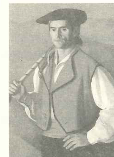
Juan Inazio Iztueta Etxeberria (1767-1845)